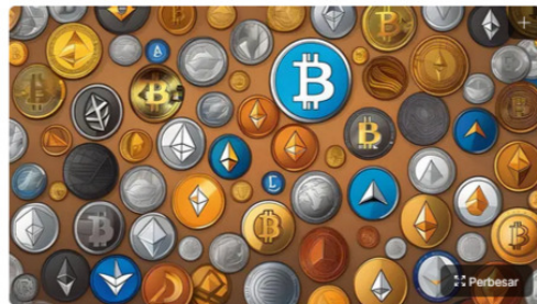
Ilustrasi berbagai macam aset kripto.

Liputan6.com, Jakarta - Badan Pengawas Perdagangan Berjangka Komoditi (Bappebti) baru saja menerbitkan peraturan terbaru yang memperkuat kerangka hukum perdagangan aset kripto di Indonesia. Melalui Peraturan Bappebti Nomor 9 Tahun 2024, sejumlah aturan dari Peraturan Nomor 8 Tahun 2021 mengalami revisi, dengan fokus pada peningkatan perlindungan konsumen, pengawasan transaksi, dan tata cara pendaftaran Pedagang Fisik Aset Kripto (PFAK).