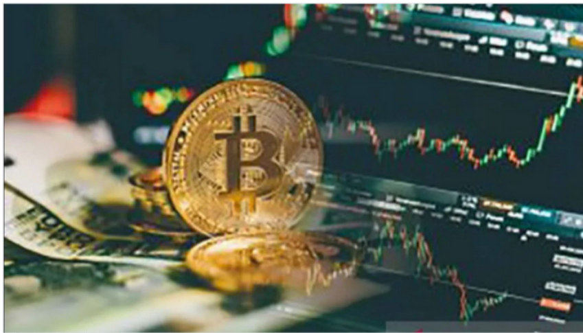
Ilustrasi aset kripto

Bagikan: JAKARTA - Kepala Badan Pengawas Perdagangan Berjangka Komoditi (Bappebti) Kasan, optimis dengan potensi perdagangan derivatif kripto di Indonesia. Karena menurutnya, derivatif dapat mendorong peningkatan transaksi aset kripto hingga lima kali lipat.