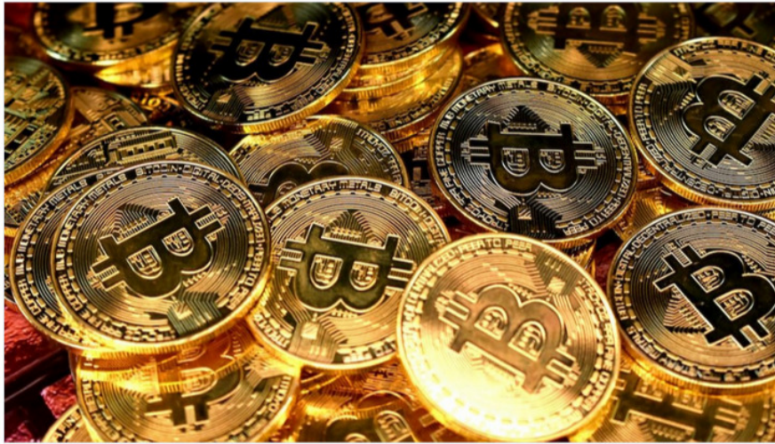
Aset Kripto

Bagikan: JAKARTA – Badan Pengawas Perdagangan Berjangka Komoditi (Bappebti) Kementerian Perdagangan (Kemendag) buka suara mengenai dugaan peretasan atau hack platform perdagangan aset kripto, Indodax.