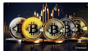
Investor Kripto.

Transaksi dilakukan di dalam bursa dan proses penjaminan, serta penyelesaian transaksi (settlement) dilakukan oleh Lembaga Kiring Berjangka yang telah mendapatkan izin Bappebti.