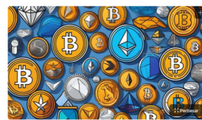
Badan Pengawas Perdagangan Berjangka Komoditi (Bappebti) terus berupaya untuk mendorong inovasi perdagangan aset kripto di Indonesia.

Agustina Melani Published 12 Sep 2024, 09:48 WIB