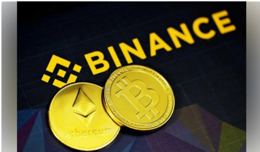
Industri Lokal Dukung Kominfo Blokir Akun Instagram Bursa Kripto Asing

Pengusaha kripto dalam negeri mendukung langkah Kominfo atau Kementerian Komunikasi dan Informatika memblokir akun Instagram resmi bursa kripto asing yang tidak berizin di Indonesia, seperti Binance , Binance Indonesia, Bybit, Bybit Indonesia, Bitget Indonesia, Kucoin Exchange, dan Mexc.