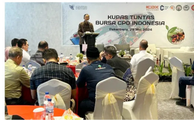
Sosialisasi bursa CPO di Pekanbaru

Jakarta, BeritaManado.com — Indonesia Commodity & Derivatives Exchange (ICDX) atau Bursa Komoditi dan Derivatif Indonesia (BKDI) melakukan sosialisasi Bursa CPO di Pekanbaru, Riau.