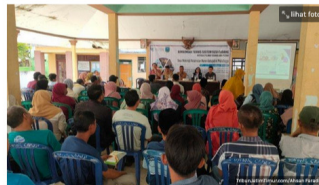
Berita Probolinggo: Bappebti Kemendag RI sebut sistem Resi Gudang di Probolinggo Saingi Daerah Lain.

Penulis: Ahsan Faradisi | Editor: Sri Wahyuni