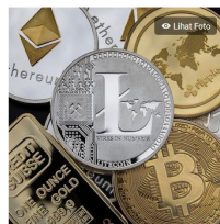
Rutbasi aset kripto.

Bulan Mei ditetapkan sebagai bulan untuk meningkatkan pemahaman masyarakat terkait kripto dan blockchain.