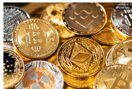
Rutbasi aset kripto, kripto.