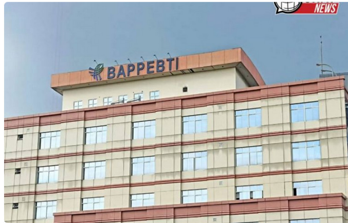
Gedung BAPPEBTI.

CHATNEWS - Edukasi terkait aset kripto terus digalakkan. Badan Pengawas Berjangka Perdagangan Komoditi (Bappebti) bersama platform jual/beli dan investasi kripto, PT Pintu Kemana Saja gencar mendorong peningkatan literasi aset kripto di tingkat mahasiswa.