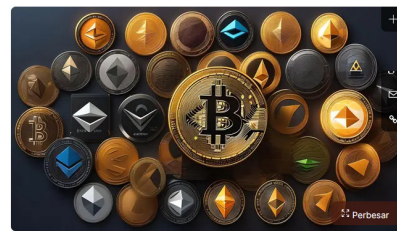
Perkembangan pesat industri aset kripto di Indonesia memicu dinamika yang perlu dihadapi dengan langkah strategis. Badan Pengawas Perdagangan Berjangka Komoditi (Bappebti) sebagai regulator utama terus melakukan mitigasi untuk menjaga stabilitas dan melindungi investor. Ilustrasi Kripto. (Foto By All)

Gagas Yoga Pratomo Diperbarui 19 Mei 2024, 16:40 WIB