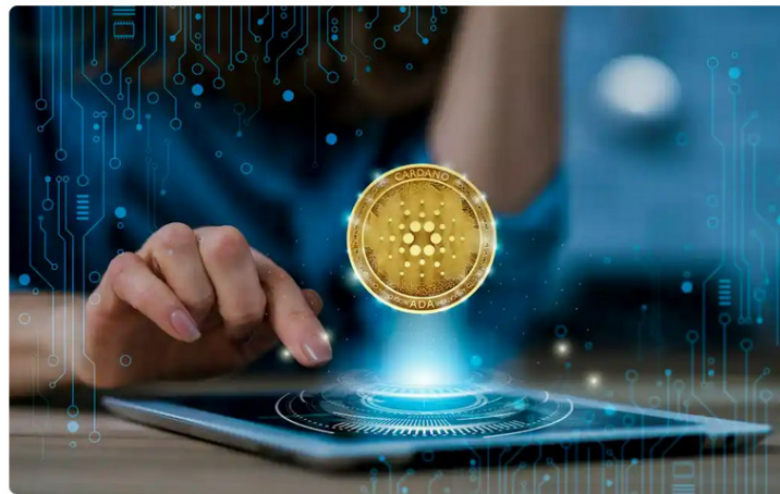
Teknologi Blockchain, Cardano dan Kripto.

CHATNEWS - Badan Pengawas Perdagangan Berjangka Komoditi ( Bappebti ) Kementerian Perdagangan terus memperkuat pengembangan aset digital. Salah satunya dengan membentuk Komite Aset Kripto di Indonesia.