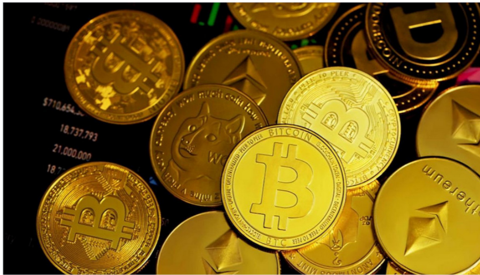
Ilustrasi aset kripto