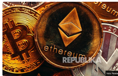
Lang kripto (ilustrasi)

REPUBLIKA.CO.ID, JAKARTA -- Badan Pengawas Perdagangan Berjangka Komoditi (Bappebti) Kementerian Perdagangan menyebut perdagangan aset kripto menjadi salah satu strategi pemerintah percepatan ekonomi digital Indonesia.