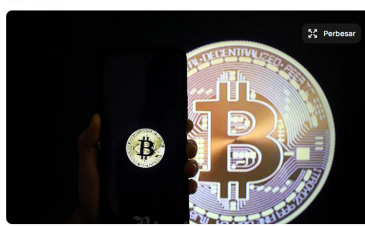
Bappebti menerbitkan surat edaran (SE) tentang Penegasan Implementasi Penyelenggaraan Perdagangan Pasar Fisik Aset Kripto di Bursa Berjangka.