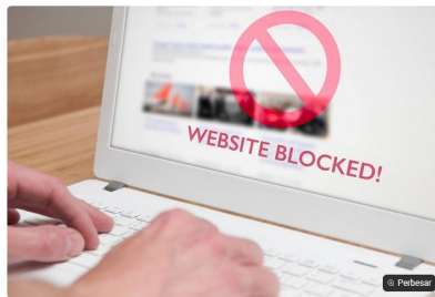
Bappebti Blokir 1.855 Situs Entitas Perdagangan Berjangka Komoditi Ilegal.

kumparanBISNIS 6 Februari 2024 17:15 WIB · waktu baca 3 menit