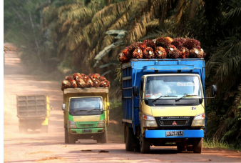
Truk bermuatan kelapa sawit menuju pabrik Permata Bunda di Pematang Panggang, Mesuji, Ogan Komering Ilir, Sumatera Selatan, Senin (11/10/2023).

oleh Patricia Yashinta Desy Abigail 11 Oktober 2023, 15:36