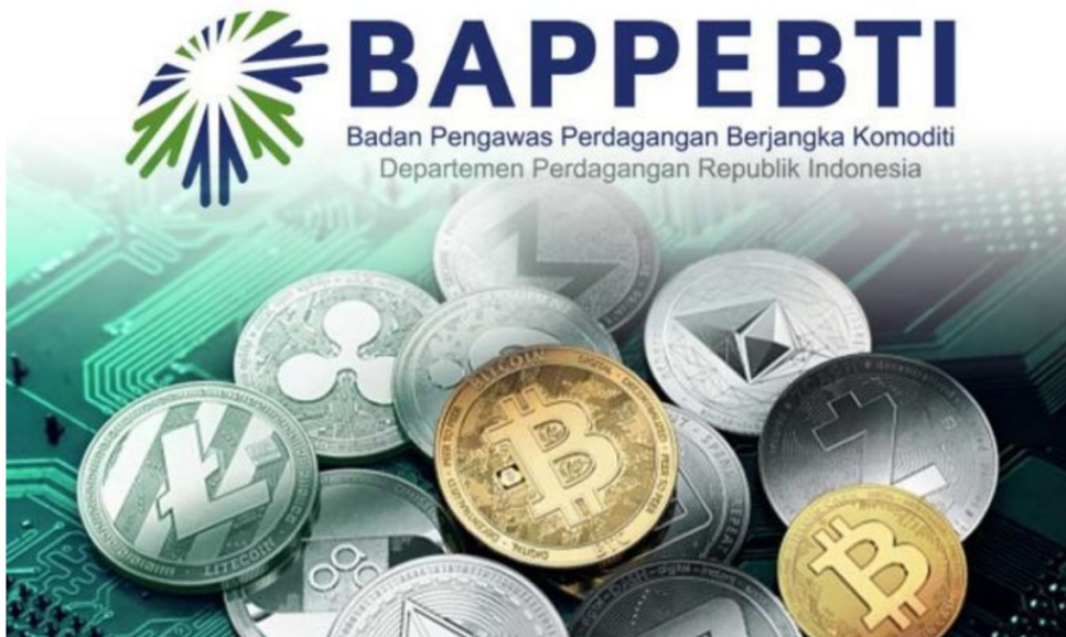
Didid juga memprediksi, perdagangan kripto masih dalam musim 'winter' pada tahun ini. Sehingga masih belum bisa bangkit kembali.