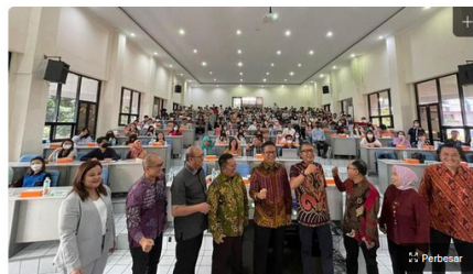
Talk Show Perdagangan Berjangka Komoditi yang diprakarsai PT Agrodana Futures di Universitas Surabaya. (Istimewa)

Liputan6.com, Surabaya - Kepala Bappebti Didid Noordiatmoko menyatakan, masyarakat perlu paham cara berinvestasi yang aman di Perdagangan Berjangka Komoditi (PBK) agar bisa ikut mengambil manfaat dari industri ini.