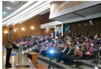
Badan Pengawas Perdagangan Berjangka Komoditi (Bappebti) Kementerian Perdagangan menyelenggarakan kuliah umum bersama Jakarta Futures Exchange dan Valbury Asia Futures di Universitas Katolik Soejiatnata, Semarang, Sabtu (14/3/2023).

SEMARANG, NIAGA.ASIA – Badan Pengawas Perdagangan Berjangka Komoditi (Bappebti) Kementerian Perdagangan terus berupaya memperbaiki ekosistem Perdagangan Berjangka Komoditi (PBK) untuk memperkuat perlindungan serta literasi kepada seluruh lapisan masyarakat terhadap industri PBK.