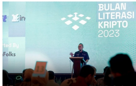
Menteri Perdagangan, Zulkifli Hasan

Ekonomi © KAMIS, 02 FEBRUARI 2023 | 15:35 WIB