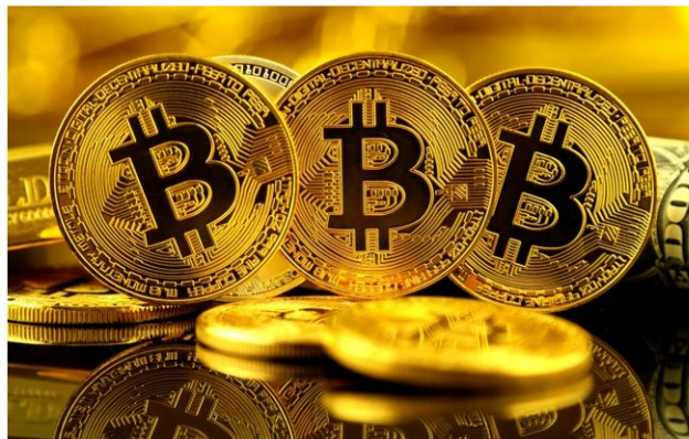
Kripto.