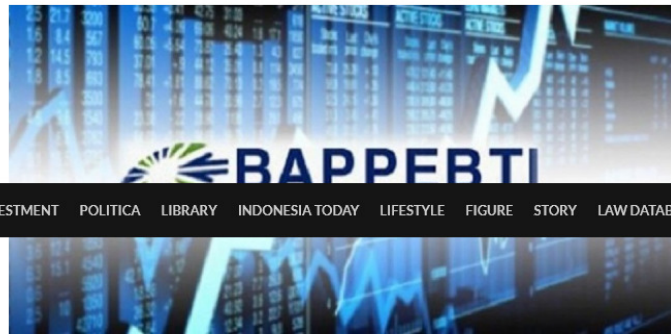
Bappebti godok badan aset kripto

Dikatakan Plt Kepala Biro Peraturan Perundang-undangan dan Penindakan Bappebti, M Syist, sedang dilakukan uji tes kepatutan dan kelayakan (fit and propret test) terhadap calon dewan komisaris dan direksi bursa aset kripto.