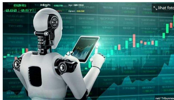
ilustrasi robot trading