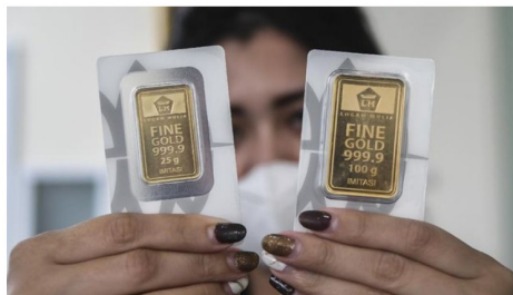
Harga jual emas Antam terendah di Rp938 ribu per gram pada perdagangan Rabu (24/2) pagi. Ilustrasi.