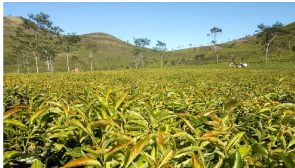
Kementerian Perdagangan melihat potensi ekspor teh, kopi, dan kakao ke Inggris pasca brexit. Terutama, setelah lockdown dihapuskan nantinya.