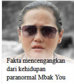
Fakta mencengangkan dari kehidupan paranormal Mbak You