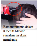
Rambut tumbuh dalam 8 menit! Metode rumahan ini akan membantu

Pendaftaran dilakukan secara daring karena tidak memiliki kantor di Indonesia.