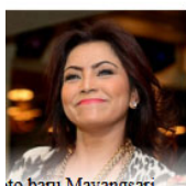
to baru Mayangsari an membuat Anda tawa terbahak-bahak