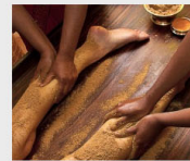
Rawat varies di rumah dengan 1 obat yang efektif

© 2021 TRIBUNnews.com Network, a subsidiary of KG... All Right Reserved